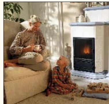
Wohlige Wärme durch einen mit Gas beheizten Kamin

nachvollziehbar sind. Mit anderen Worten: Stiegen die Preise der Vorlieferanten, musste auch die EVS ihre Preise anpassen. Sanken die Preise des Vorlieferanten, gab die EVS den Nachlass mindestens in vollem Umfang an ihre Kunden weiter. Verfahren und detaillierte Inhalte der Prüfung können interessierte Kunden in Kürze auch im Internet unter www.tuv.com nachlesen. Zur Sicherung der Qualität der