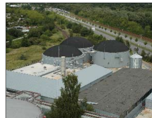
Die schwarzen halbrunden Dächer der Biogasanlage bestehen aus einer Art Teichfolie, die sich heben und senken kann

Die Biogasanlage in Schwerin Süd ist seit fast einem halben Jahr erfolgreich in Betrieb