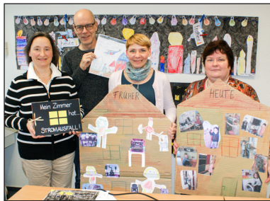
Die Jury hat entschieden