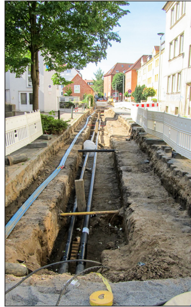
Verlegung von Fernwärmeleitungen in der Lortzingstraße

Über eine Fernwärmestation gelangt die Wärme der Stadtwerke einfach und bequem ins Haus bzw. in die Wohnung. Damit die Station lange und zuverlässig arbeitet, sollte sie regelmäßig gewartet werden. Hierfür sowie für den Austausch alter Fernwärme-Hausstationen halten die Stadtwerke für Kunden interessante Angebote bereit. Wer sich dafür interessiert oder Fragen zur Fernwärme hat, erhält unter der Telefonnummer (0385) 633-1818 oder im Internet unter www.stadtwerke-schwerin.de/fernwaerme weitere Informationen. anm