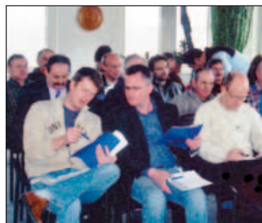
Fachlicher Gedankenaustausch beim Seminar der Netzgesellschaft

Schwerin • Die Netzgesellschaft Schwerin (NGS), eine Tochtergesellschaft der Stadtwerke Schwerin, lud Anfang März ihre Zählermonteure sowie Installateurunternehmen zu einem Informationsseminar ein. 36 Teilnehmer nutzten die Veranstaltung, um sich über die Europäische Messgeräterichtlinie sowie über neue Regelungen im Eichrecht zu informieren. Das Seminar diente dazu, ganz unabhängig vom Alltagsgeschäft, Gespräche mit den lokalen Partnern zu führen, um so auch die Aufgaben und das Wirken der Netzgesellschaft den Installateuren näher zu bringen.