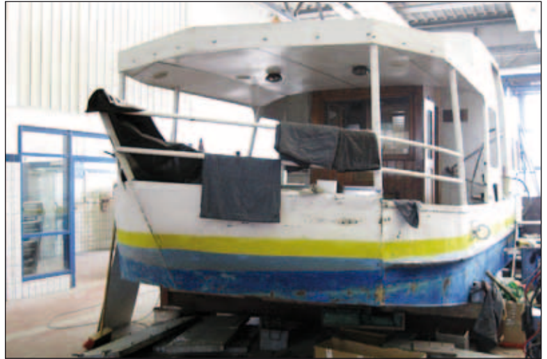
Im „Trockendock“ des Schweriner Nahverkehrs wurde die Petermännchenfähre für die neue Saison hergerichtet

Bereits seit 1879 gibt es einen Fährverkehr auf dem Pfaffenteich und schon seit 32 Jahren, dem 100. Geburtstag, trägt