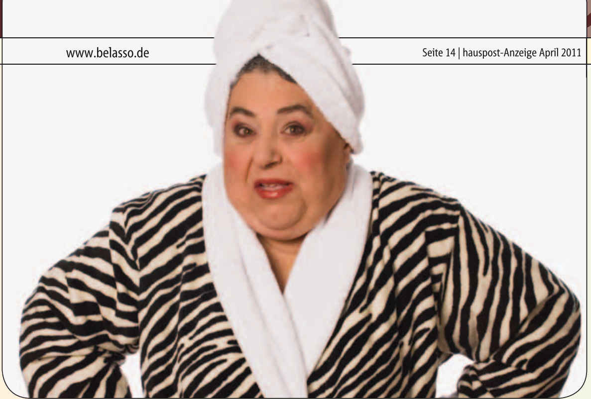
Nach einem abwechslungsreichen Kurs im Speck-lass-nach-Programm ist die Sauna genau das Richtige zum Entspannen

Die nordische Pflanze ist genau das richtige, um dem Körper etwas Frühling zu gönnen. Sie ist reich an Vitami- nen und versorgt den ihn mit ausreichend Feuchtigkeit. Eine 20-minütige Massage kostet 22 Euro.