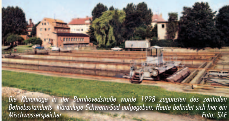
Die Kläranlage in der Bornhövedstraße wurde 1998 zugunsten des zentralen Betriebsstandorts Kläranlage Schwerin-Süd aufgegeben. Heute befindet sich hier ein Mischwasserspeicher