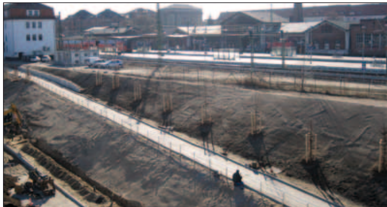
Über einen eigens angelegten Weg erreicht man vom Bahnhof den Parkplatz

Werkstatt des Nahverkehrs Schwerin der Fähre wieder ein schmales blau-weißes Kleid verpasst und die Innenausstattung sowie den Motor aufgearbeitet. Jetzt ist die Fähre auch mit einer Toilette ausgestattet. Damit ist das Schweriner Wahrzeichen bestens für die Saison 2011 gerüstet.