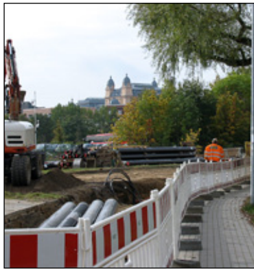
In der Grünen Straßen werden Fernwärmeleitungen verlegt

leitungen verlegt. Der nächste Bauabschnitt führt von der Graf-Schack-Allee über den Alten Garten bis hin zur Grünen Straße. Weitere Erschließungen folgen im nächsten Jahr. Für Hausbesitzer, die sich in den neuen Bauabschnitten an die Fernwärme anschließen lassen wollen, gibt es auch im nächsten Jahr die Möglichkeit der Förderung durch das Fernwärmeausbauprogramm der Stadtwerke. Nähere Informationen erhält man im Internet unter www.stadtwerke-schwerin.de oder unter der Telefonnummer (0385) 633 1818.