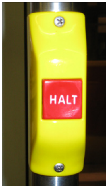
Die Taster übermitteln den Haltewunsch und öffnen die Türen

Schwerin • In den Bussen und Bahnen der Nahverkehr Schwerin GmbH schließen sich die Türen automatisch, sobald der Einstiegsbereich länger als sechs Sekunden frei bleibt. Das ist vor allem in der kalten Jahreszeit praktisch, denn so kühlen die Fahrzeuge nicht aus und die Passagiere müssen nicht frieren.